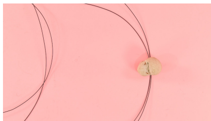
2. מניחים שני חוטים

יוצרים ביחד עם האמנית תמר לוי אלפסי עכביש מחוטי ברזל