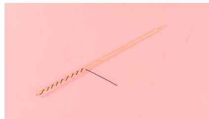
*אפשר גם ללפף חוט סביב שיפוד כדי לקבל תלתלים או קפיצים ולחבר לעוד דמויות שתצרו (ראו תמונה מספר 7)