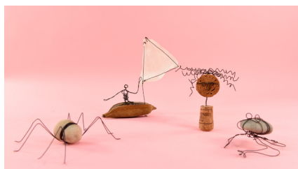
7. דמויות נוספות שאפשר ליצור באותה טכניקה