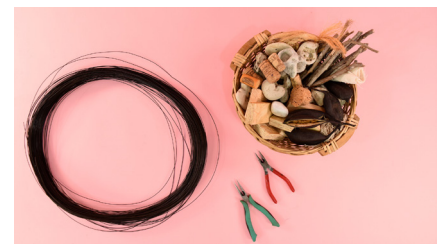
מה צריך? חוט ברזל, חפץ שיש בבית או בטבע: אבן, פיסת עץ, פקק שעם... קאטר, שפיץ פלייר