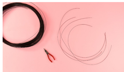
1. חותכים חוטי ברזל. לעכביש תצטרכו ארבעה חוטים באורך 30 ס"מ