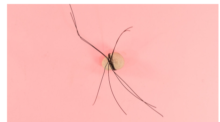
3. מניחים שני חוטים נוספים מתחת לאבן ומלפפים