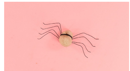
6. חותכים את השאריות